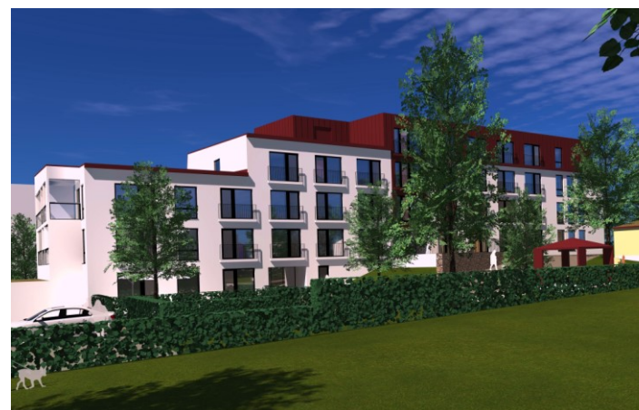
Näkymä sisäpihan puolelta