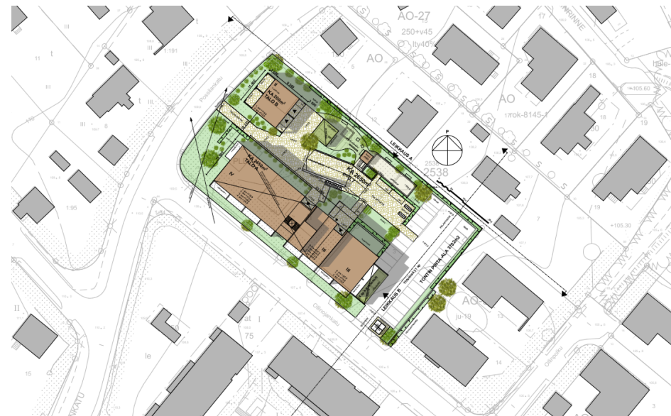
Uudisrakennukset sovitettuna ympäröivään rakennuskantaan