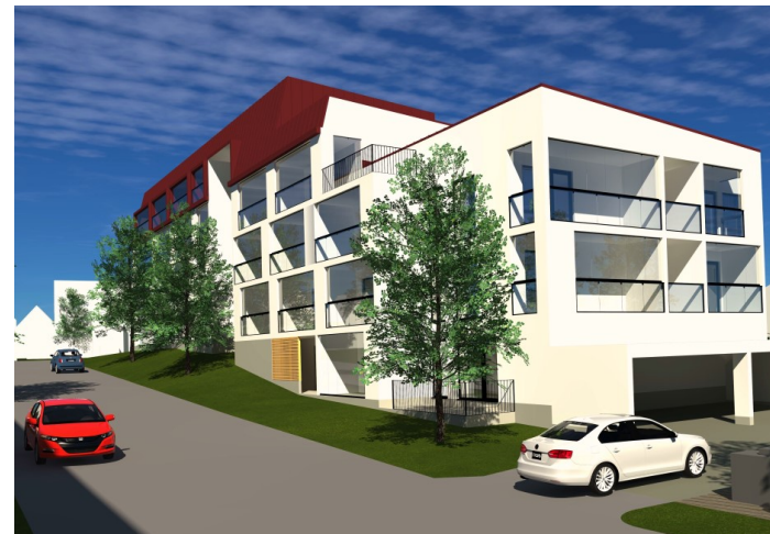
Näkymä Ollinojankadulta luoteeseen

Asuinrakennusten pääjulkisivumateriaalin tulee olla vaalea rappaus.